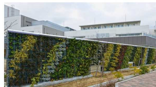
図3 壁面緑化例(上:鉄道沿線、下:保育施設)

視覚的圧迫や照り返し、落書きなど、住環境悪化に繋がりがちな擁壁や遮音壁に対して、その機能に影響を与えることなく低管理で確実な全面緑化を実現した高い技術力と、都市インフラとなる土木構造物に巨大な「緑の帯」を創出し公的空間の景観向上に寄与した点が評価されました。