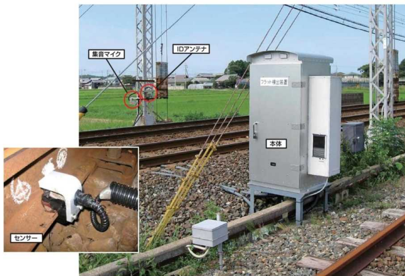
沿線に設置されているフラット検出装置