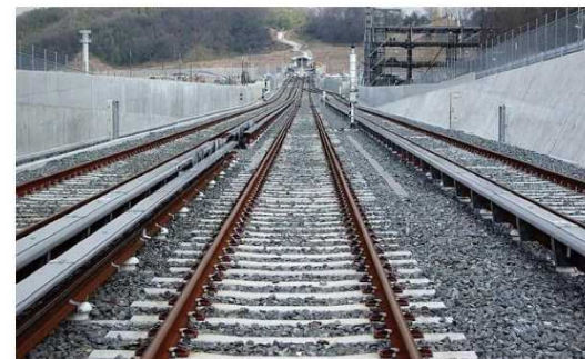
図2 ロングレール採用例

従来のレールを溶接してロングレール化することにより、レールの継ぎ目を減少させ、騒音・振動の低減、乗り心地の向上を図っています。また、既存のレールよりも重いレールへ取り替えることにより、列車走行の安定化とともに騒音・振動の低減を図っています。