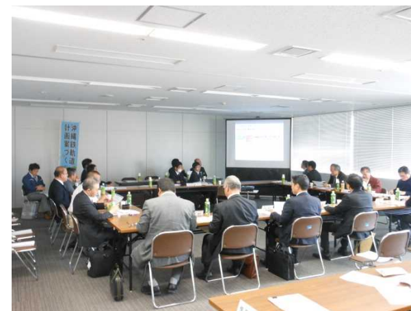
写真：平成28年2月10日 沖縄県南部合同庁舎