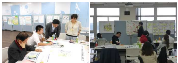
写真：平成28年1月30日 名桜大学