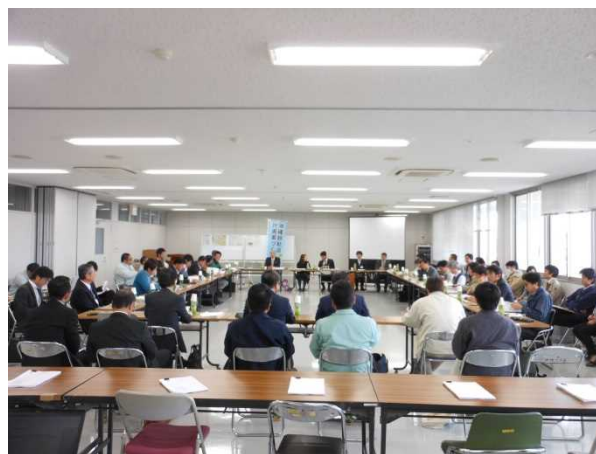
写真：平成28年2月3日 沖縄県中部合同庁舎