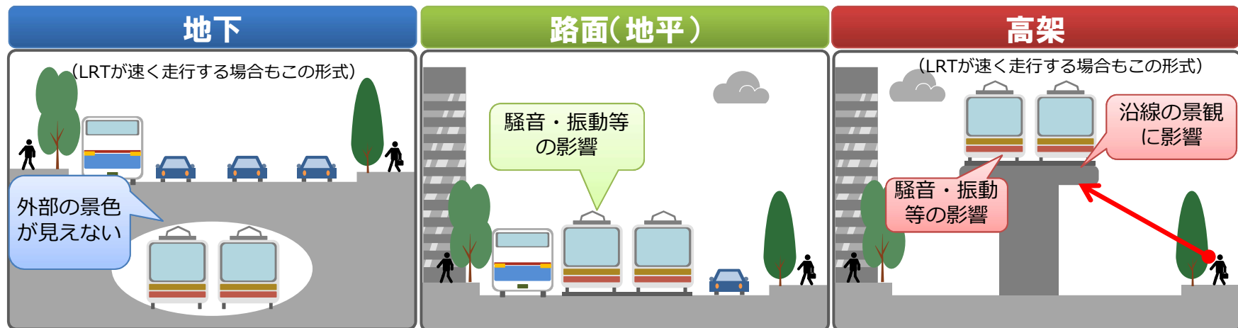
鉄軌道導入による環境、景観への影響例(地下、路面、高架)